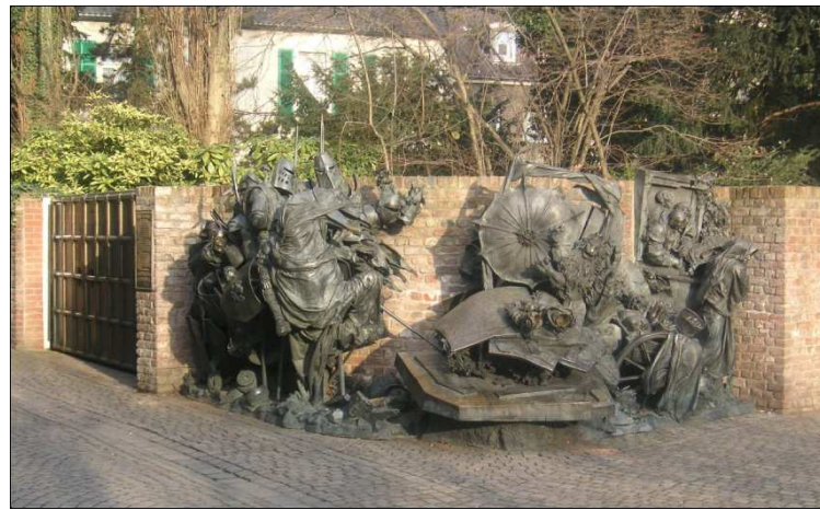
Das am nordöstlichen Platzrand gelegene Stadterhebungsmonument

Auf dem Burgplatz endete dann die Stadtführung und wir gingen zum Mittagessen auf das Schiff Allegra.