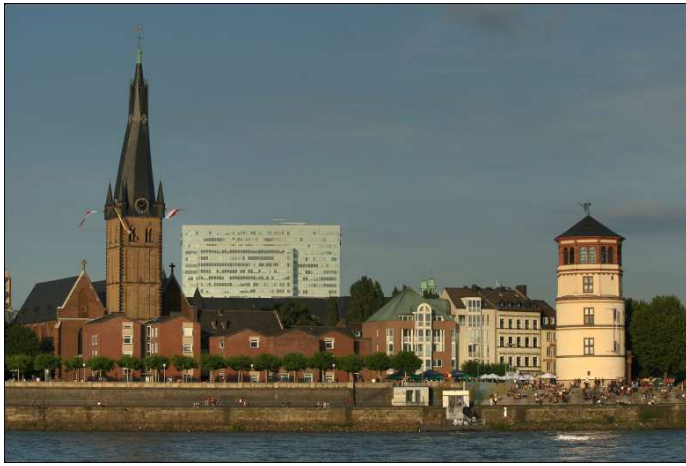
St. Lambertus und Burgplatz mit Schossturm