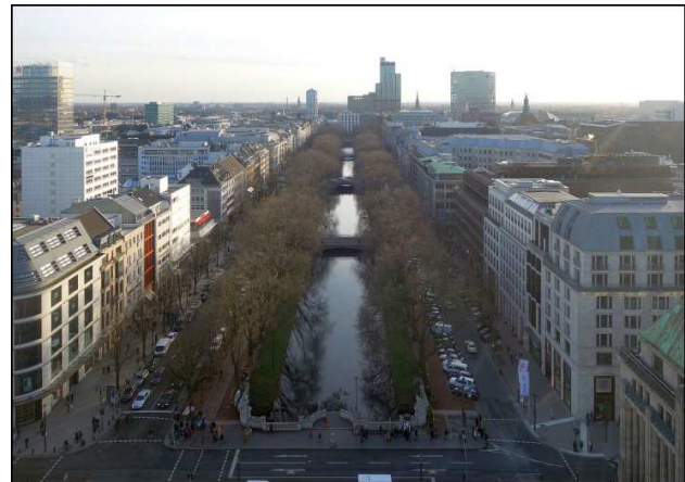
Blick auf die Königsallee

Die Königsallee liegt östlich der Düsseldorfer Altstadt. Weite Teile der Altstadt sind Fußgängerzone mit zahlreichen Ladenlokalen und gastronomischen Einrichtungen. Auf einem halben Quadratkilometer ballen sich hier über 300 Kneipen, Diskotheken und Restaurants. Man nennt sie wird daher „längste Theke der Welt“.